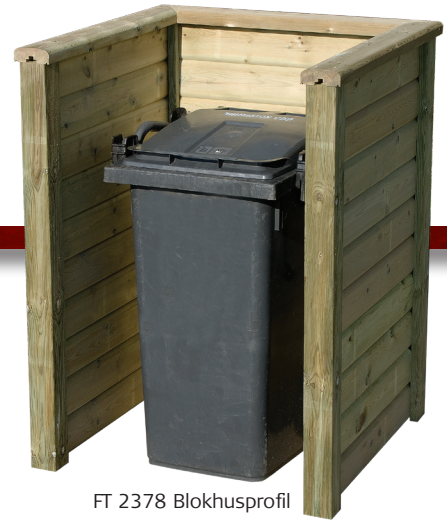
FT 2378 Blokhushusprofil