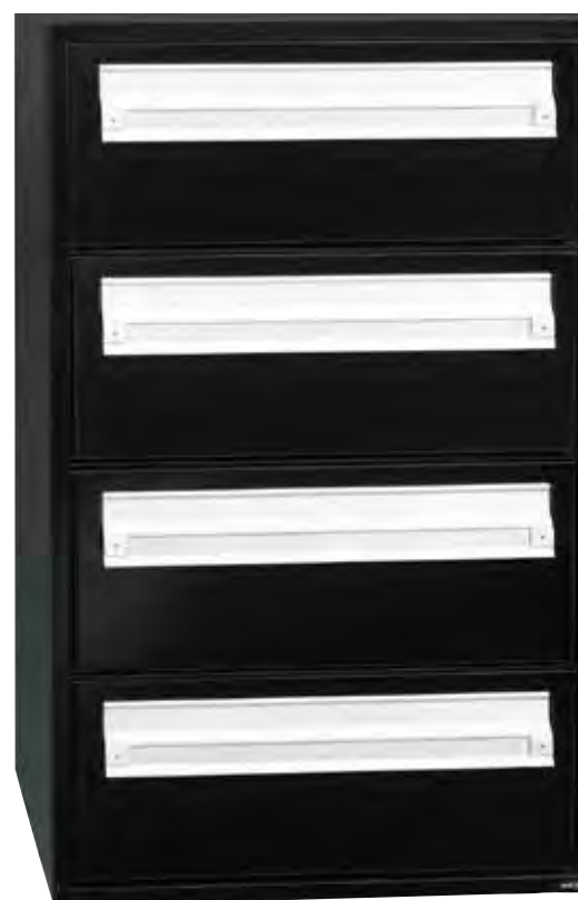
Front med indkast