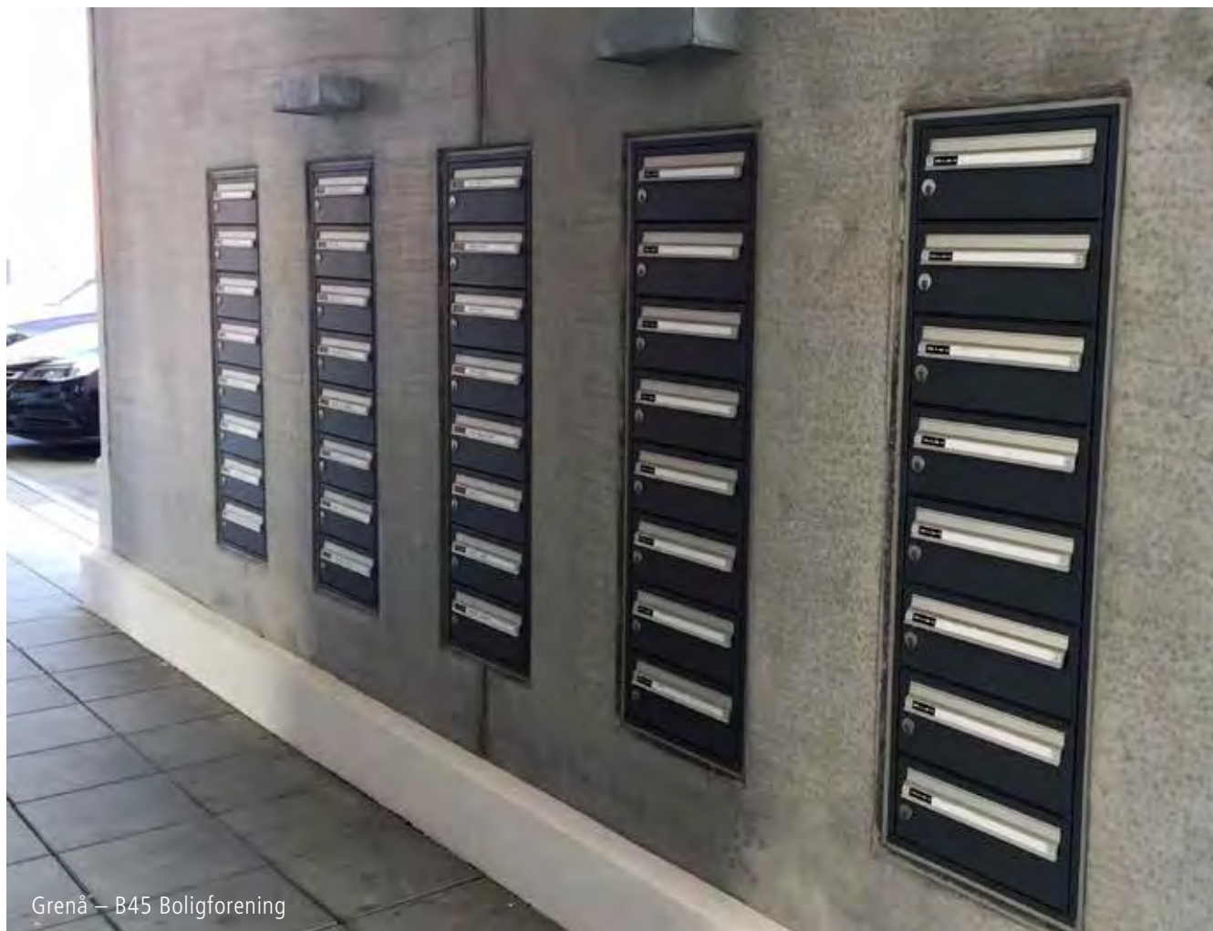
Grenå – B45 Boligforening