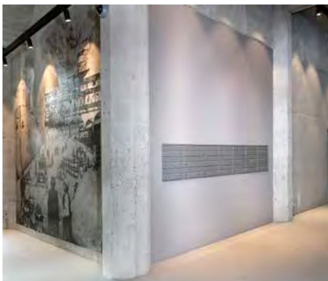
Renz Plan, RAL 9007, The Silo, København