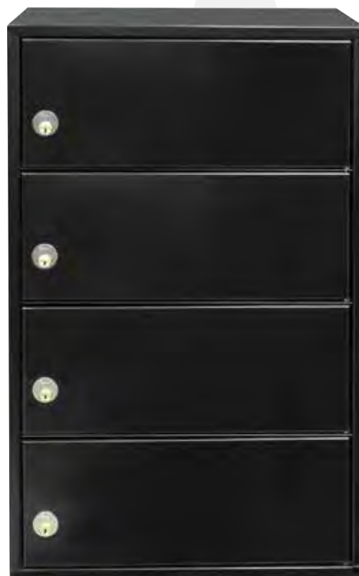
Bagside med postudtag