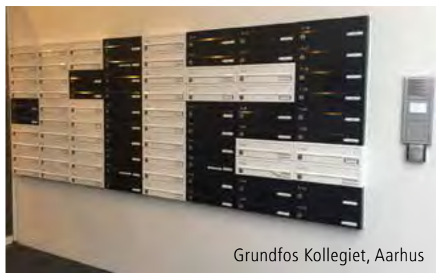
Grundfos Kollegiet, Aarhus