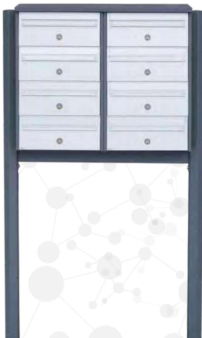
Model 700: Kabinet i hvid RAL 9016 med front i aluminium