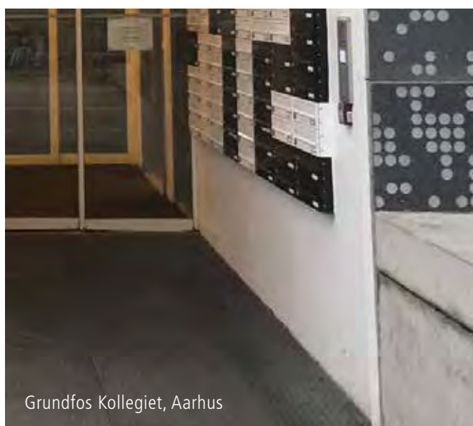
Grundfos Kollegiet, Aarhus