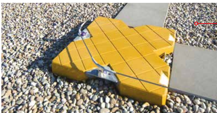
Single-ankerpunkt for 2 brugere