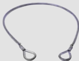
Monteringsstrop – galvaniseret stålwire