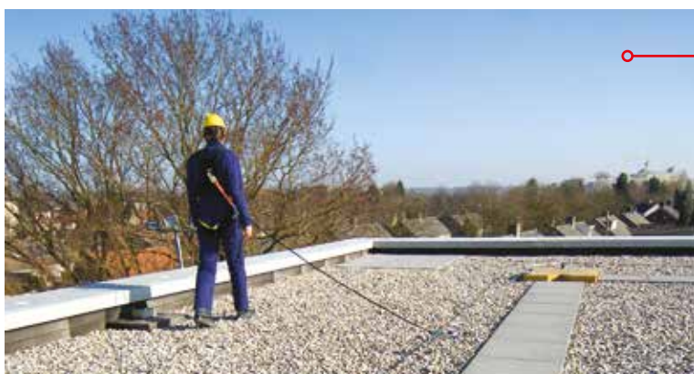
Ariana wiresystem monteret på Biboblok

Alle horisontale systemer skal efterses hver 12. måned.