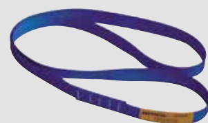
Båndstrop – polyester webbing