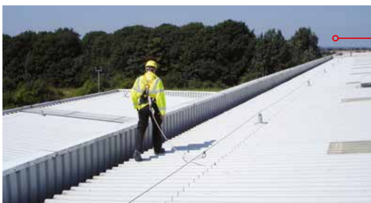
Uni-8 system monteret på Roofsafe Spiratech ankerpunkter