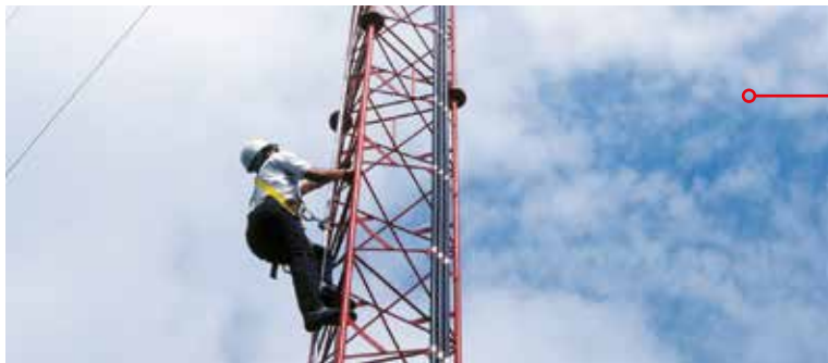
Fastmonteret Lad-Saf system