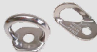
Forankringsbeslag i rustfrit stål, dråbeformet eller rundt øje