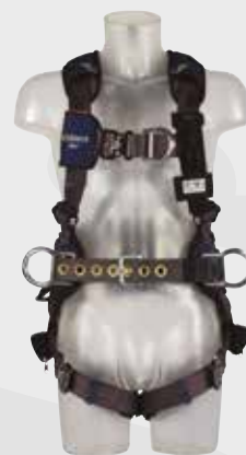
Sala ExoFit Nex med bælte