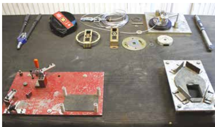
Eftersyn af faldstoptaljer foretages med specialværktøj

otto schachner kan foretage eftersyn på langt de fleste seler, reb med glidelås, falddæmperliner, mastetov og andet webbingmateriale. Vedrørende faldstoptaljer (blokke) kan vi foretage eftersyn på Sala, Protecta og Antec.