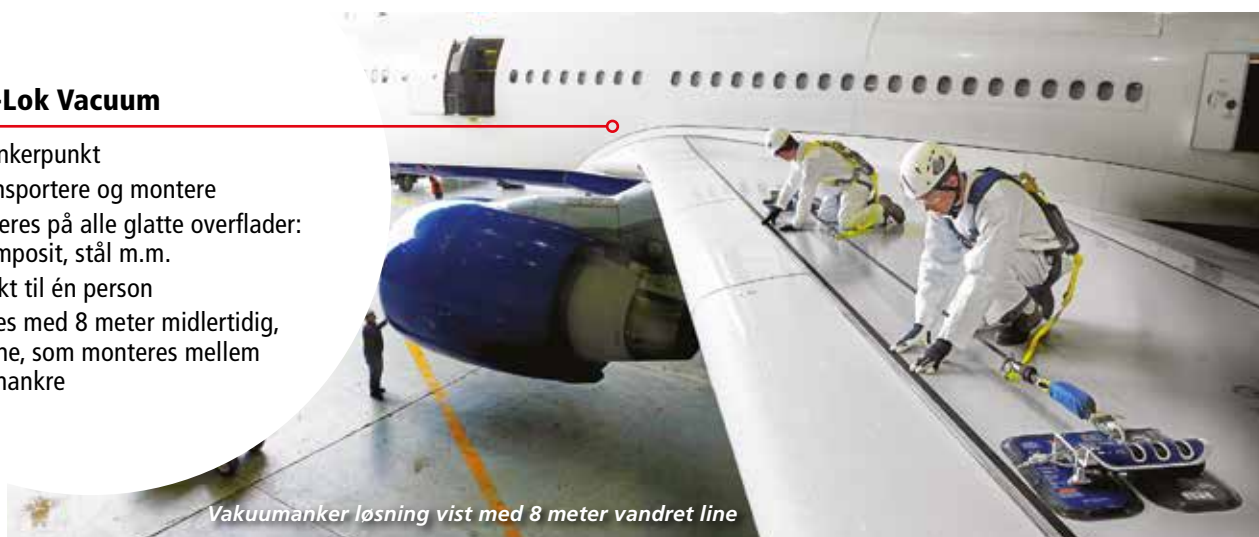
Vakuumanke løsnig vist med 8 meter vandret line